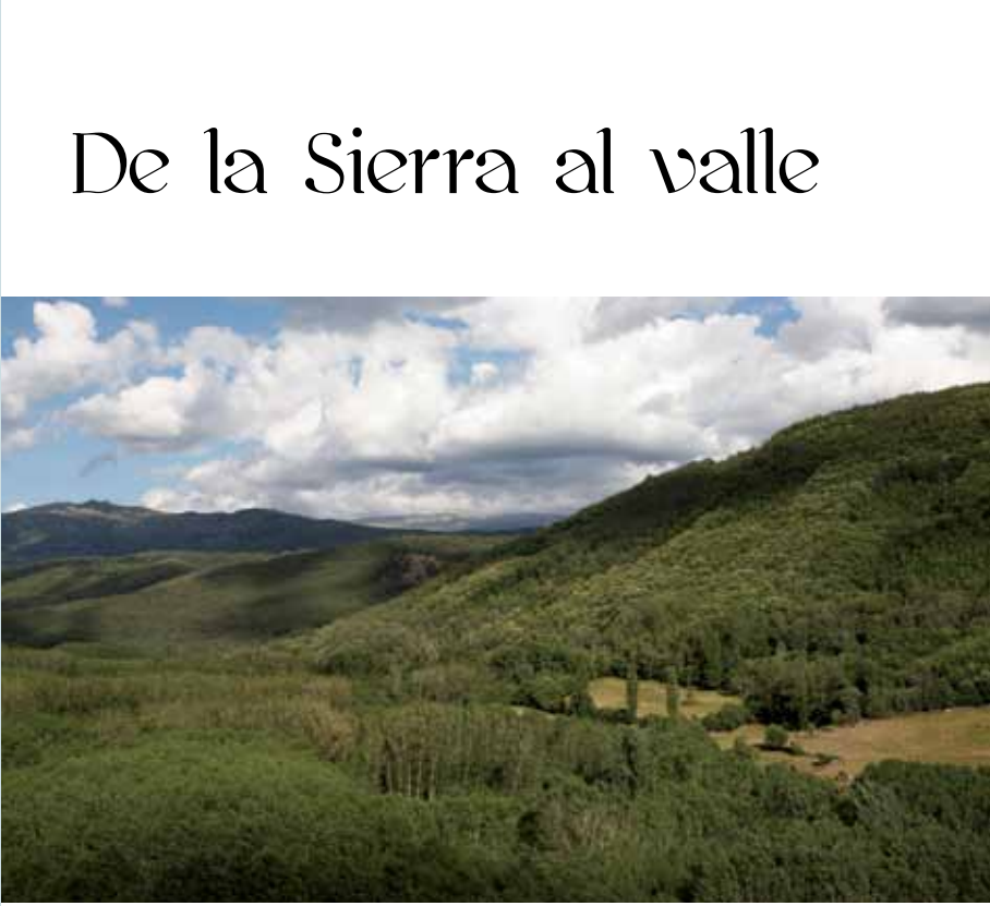
BOSQUES DE CASTAÑOS

La autovía A-66 (paralela a la antigua N-630) constituye el principal acceso a este territorio, tanto si se llega desde tierras extremeñas, como desde la propia capital y norte peninsular. La carretera SA-220 comunica la comarca con Ciudad Rodrigo y el sur provincial, mientras que las SA-100 y SA-102 facilitan el acceso desde Madrid y Ávila, por Piedrahíta y Barco de Ávila.