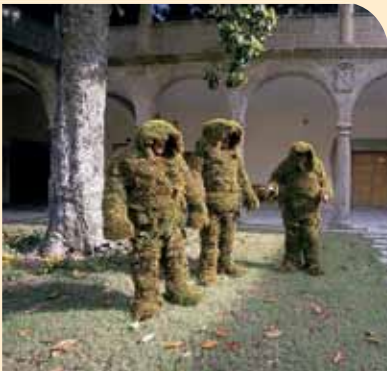
HOMBRES DE MUSGO DURANTE LA FIESTA DEL CORPUS

dos de la muralla. Cerca, la iglesia de Santiago es la más antigua de Béjar. Junto a la de Santa María la Mayor se localiza el Museo Judío David Melul, que recuerda la importante judería que hubo en Béjar. El edificio más representativo del poderío ducal es el Palacio Ducal, reconvertido en centro de enseñanza. Frente a él, la iglesia del Salvador se asoma a la plaza Mayor.