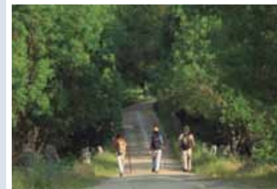
CAMINANTES EN EL PUENTE DE LA MALENA

El esfuerzo constructivo y la habilidad de los romanos en el trazado de las vías de comunicación queda aún bien patente a lo largo de la Vía de la Plata a su paso por la provincia. Uno de los rastros más evidentes es el reguero de millarios que permanecen orillados en muchos puntos de la Vía. Estos grandes bloques cilíndricos de granito servían para marcar las