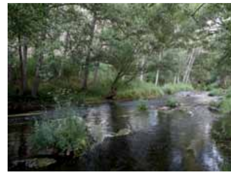
RÍO CUERPO DE HOMBRE

los que abundan densos castaños. Y arriba y abajo se localiza un reguero de poblaciones que han sabido conservar en buena medida una encantadora personalidad serrana.