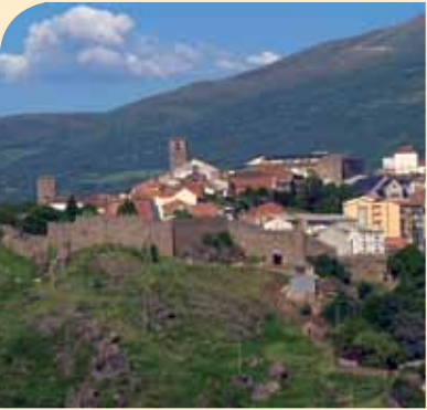
MURALLA MEDIEVAL Y CONJUNTO URBANO