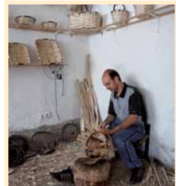
TALLER DE CESTERÍA DEL CASTAÑO

Los densos castañares que rodean esta localidad tienen mucho que ver con la ocupación más tradicional de sus habitantes. Si en el pasado la tonelería fue una de las principales industrias de Montemayor del Río, hoy lo es la elaboración de