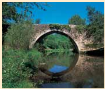
PUENTE DE PIEDRA