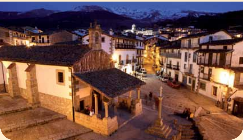
ERMITA DEL HUMILLADERO