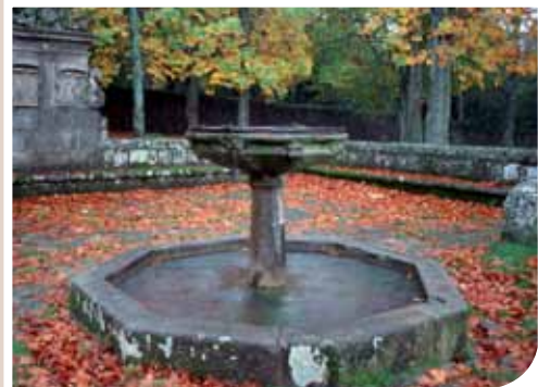
JARDÍN "EL BOSQUE", BÉJAR

El jardín de El Bosque, a las afueras de Béjar, es una de las pocas villas de recreo a la italiana que pueden disfrutarse en España. Sus orígenes están en un coto de caza perteneciente a los duques de Béjar. En el siglo XVI comienza a tomar la forma de un jardín con diversos rincones para el esparcimiento, siguiendo la moda italiana. No muy lejos de éste se encuentra el jardín de El Coto de Nuestra Señora del Carmen, en la localidad de Peñacaballera, trazado a finales del siglo XIX según los gustos románticos del momento. Destaca por la variedad botánica y la abundancia de especies exóticas.