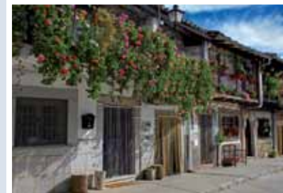
ARQUITECTURA POPULAR, LA CALZADA DE BÉJAR

distancias. Pero también es posible observar el viejo enlosado en muchos de los tramos, el alcantarillado de las cunetas o puentes de diversos tamaños. El mayor de ellos salva el Tormes en el acceso a Salamanca, que creció como ciudad gracias al paso de este importante camino.